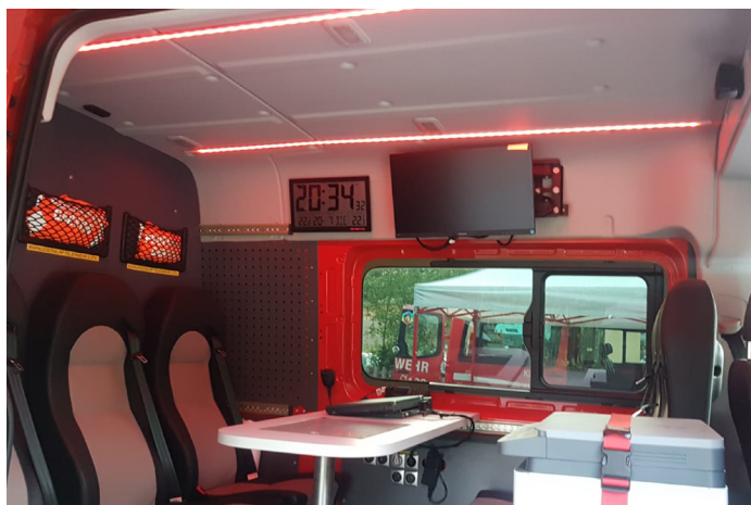
KDO der FF Garsten

Ein besonderes DANKE an alle Kamerad/innen, welche sich dieser Zusatzaufgabe im Feuerwehrdienst stellen und aktiv zur Umsetzung und Durchführung beitragen, sowie den Gemeindeverantwortlichen für die finanzielle Unterstützung.