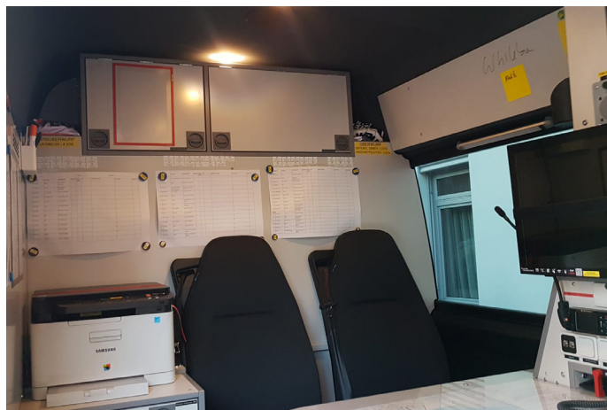
KDO der FF Schärding