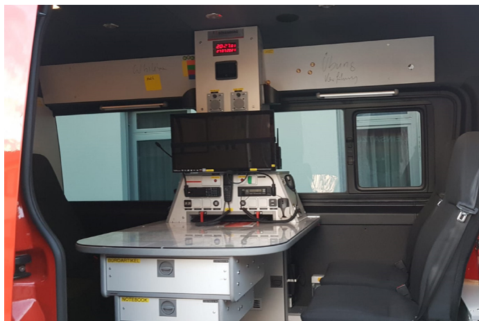
KDO der FF Schärding